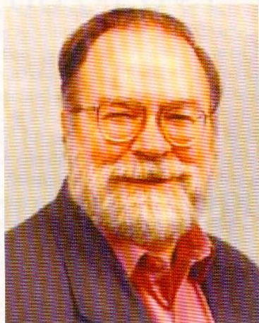
Prof. Dr. James A. Yorke

Las investigaciones actuales del Prof. Yorke van desde aspectos fundamentales de la teoría del caos a temas como la predicción atmosférica y la investigación sobre el genoma hasta problemas relacionados con dinámica de poblaciones y epidemia del SIDA.