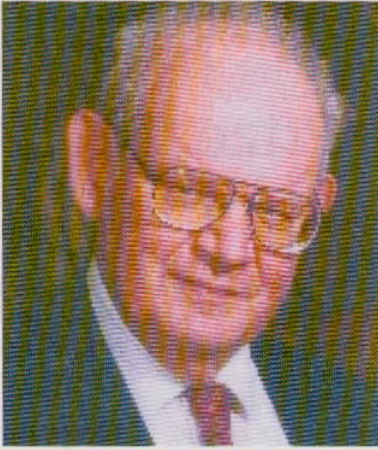
Prof. Dr. Benoit B. Mandelbrot

divisas. Existe una característica común en tales formas complejas, que es la propiedad de la autosemejanza. Esta es la propiedad por la cual cuando una parte de la forma se aumenta, el mismo tipo de estructura aparece de nuevo. El Prof. Mandelbrot descubrió que la autosemejanza es una propiedad universal que subyace en tales formas complejas y denominó la expresión fractal . Además, ha ilustrado sus propiedades de modo matemático y encontrado una nueva metodología para analizar los sistemas complejos.